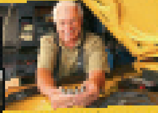
Die Montage des Ölwanne-Systems ist ein wichtiger Schritt bei der Wartung Ihres Oldtimers.